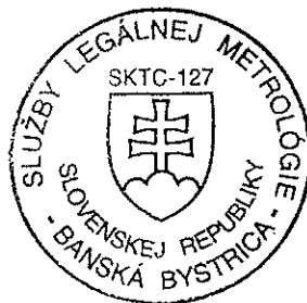
Jozef S l a m k a vedúci štátnej skúšobne SKTC - 127

Príloha je neoddeliteľnou súčasťou tohto rozhodnutia. Obsahuje kópiu certifikátu č. C/320042/127/131/98-109 s prílohou, ktorá obsahuje celkovo 4 strany.