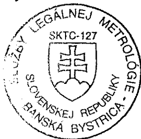
Jozef S l a m k a vedúci štátnej skúšobne SKTC - 127

P r í l o h a je neoddeliteľnou súčasťou tohto rozhodnutia. Obsahuje kópiu certifikátu č. C/320041/127/131/98-108 s prílohou, ktorá obsahuje celkovo 3 strany.