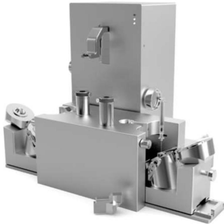
Obrázok č. 1: rozplňovacia stanica automatická dvojitá PT459R2