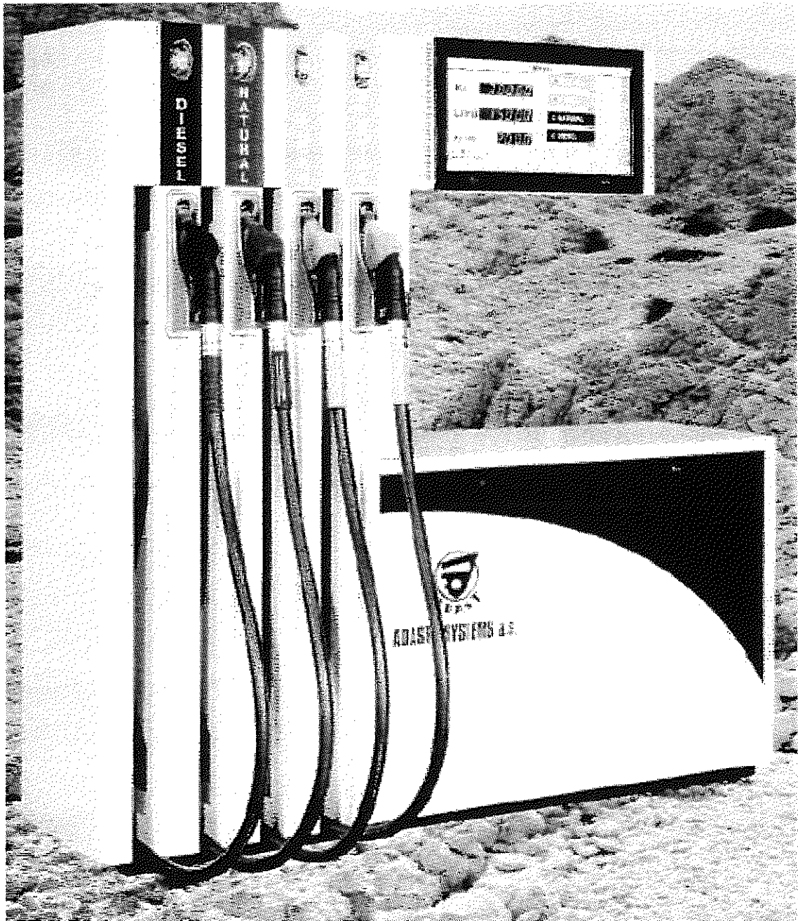
Obr. 13 : Pohľad na výdajný stojan typu ADAST 4604 (4704)